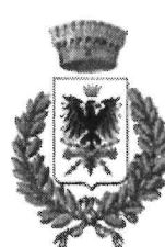
Comune di Vernasca