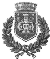
Comune di Castell’Arquato