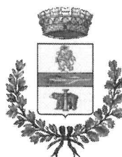
Comune di Morfasso